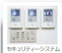
セキュリティーシステム