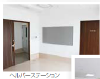
ヘルパーステーション