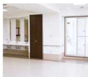
共同スペース(食堂)